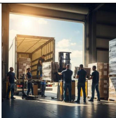
Esempio di ambiente indoor fortemente influenzato dalle condizioni meteorologiche esterne